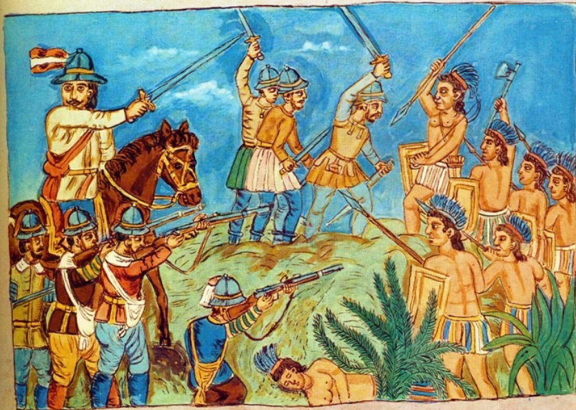
Έργον Θεοφίλου Γ. Ξ. Μιχαήλ 1931.