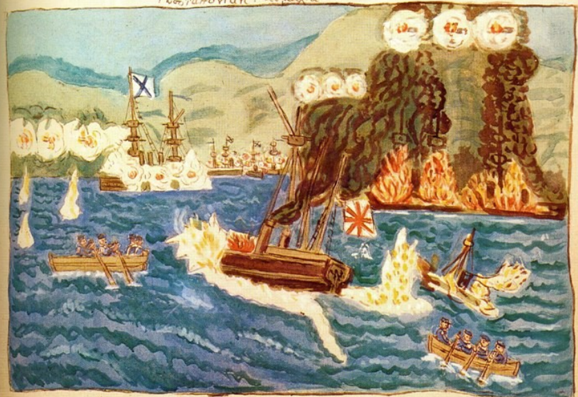
Έργον Θεοφίλου Γ. Ξ. Μιχαήλ Έξ Μουσουλίνης 1930.