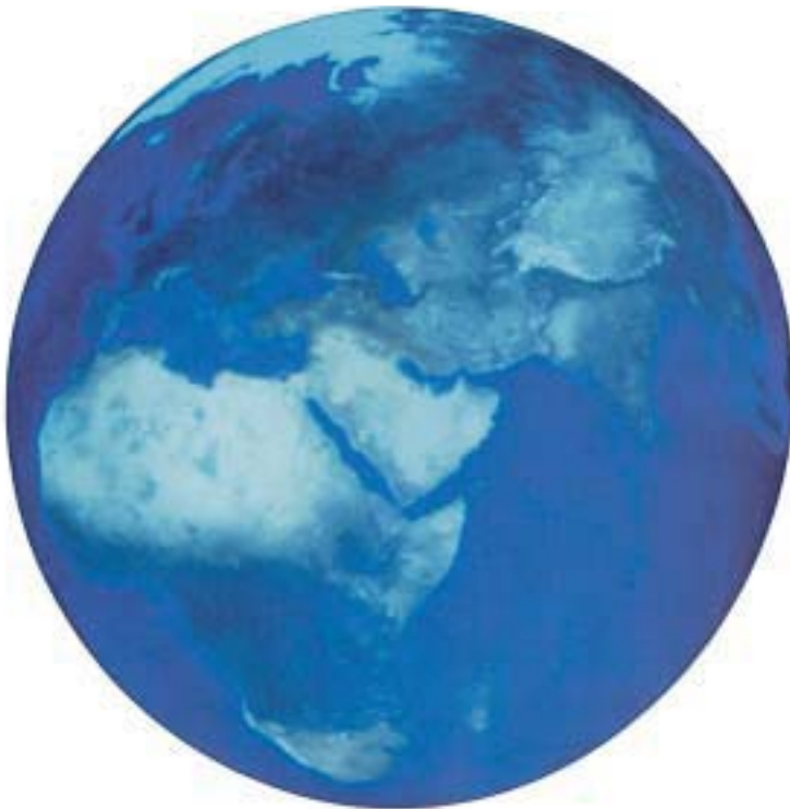
Η Γη μας