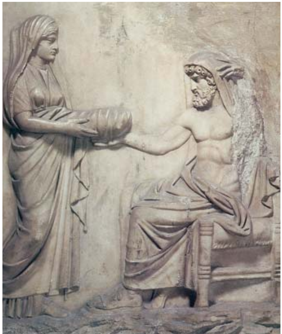
1. Η Ρέα δίνει τη φασκιωμένη πέτρα στον Κρόνο.

Έτσι ο Δίας έγινε κυρίαρχος όλου του κόσμου. Παντρεύτηκε την Ήρα και μαζί με τα παιδιά του και τ' αδέρφια του εγκαταστάθηκε στον Όλυμπο.