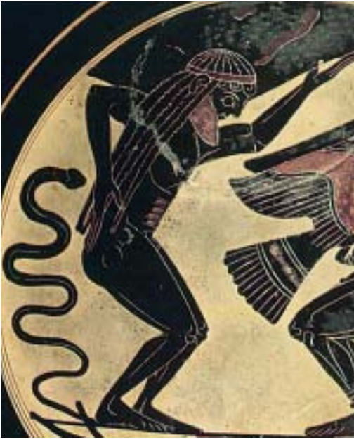
5. Ο Άτλαντας σε αρχαίο ελληνικό αγγείο.