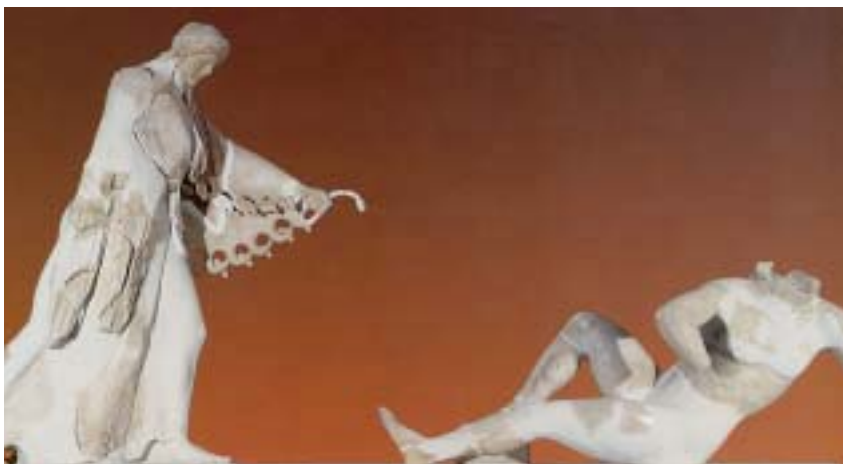
9. Η Αθηνά μάχεται με τον Εγκέλαδο. Από την παράσταση της Γιγαντομαχίας στον αρχαίο ναό της Αθηνάς, στην Ακρόπολη.

Απολλώνιος, Βιβλιοθήκη Α , 6, 2 (διασκευή)