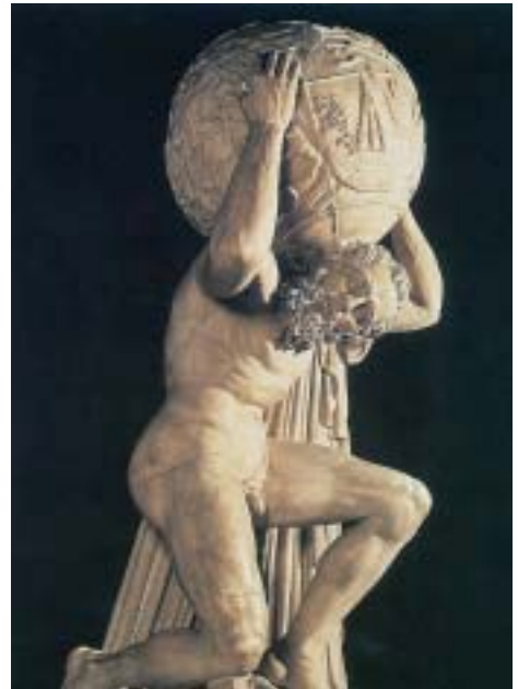
6. Ο Άτλαντας σε γλυπτό νεότερης εποχής.