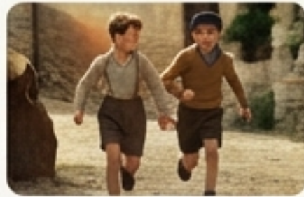
Un Sac de Billes

The Hidden Children (Κρυμμένα Παιδιά): Χιλιάδες παιδιά όπως οι Joffo αναγκάστηκαν να κρύψουν την ταυτότητά τους σε μοναστήρια, σχολεία και ανάδοχες οικογένειες για να γλιτώσουν τον εκτοπισμό.