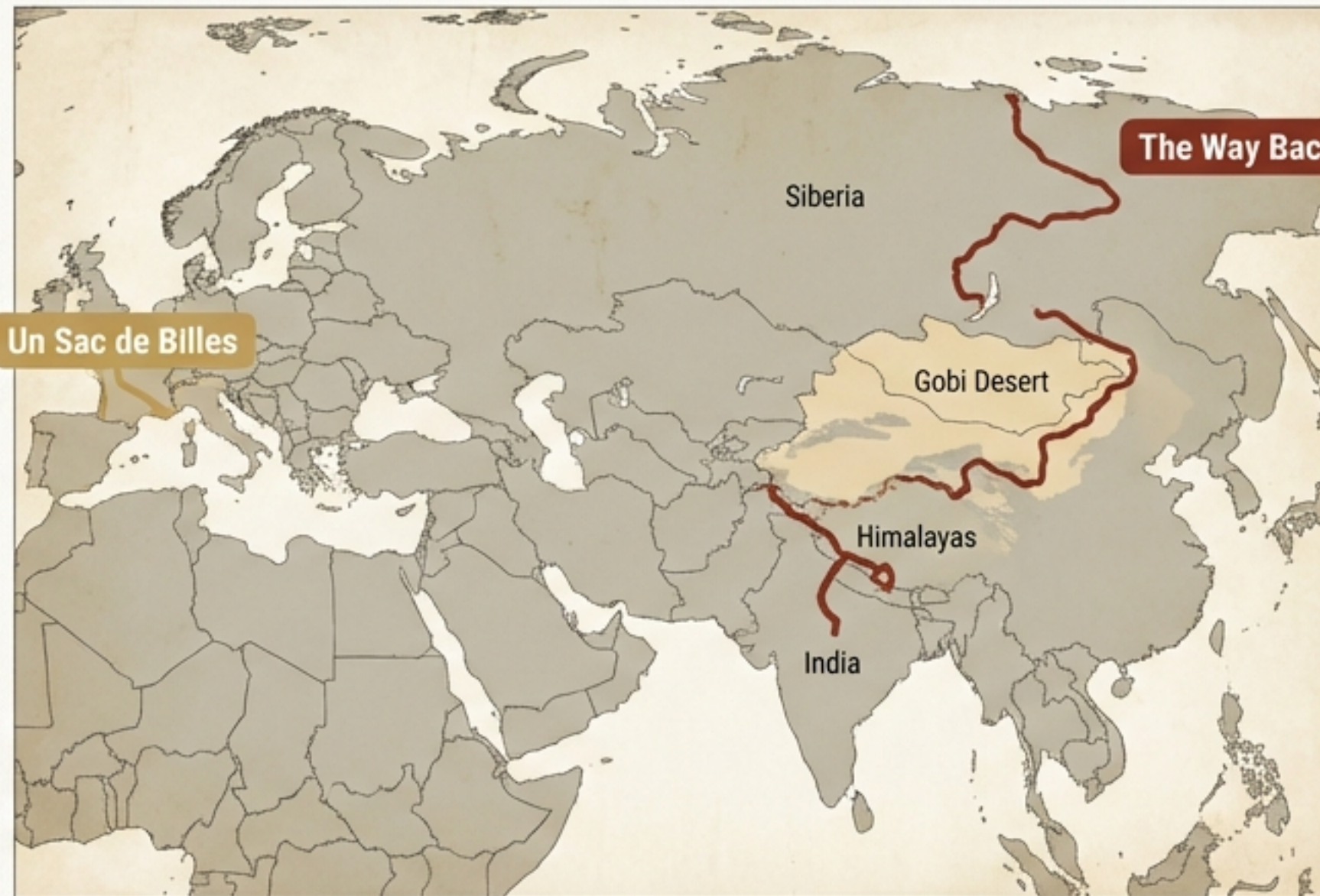
The Way Back

The Hidden Children (Κρυμμένα Παιδιά): Χιλιάδες παιδιά όπως οι Joffo αναγκάστηκαν να κρύψουν την ταυτότητά τους σε μοναστήρια, σχολεία και ανάδοχες οικογένειες για να γλιτώσουν τον εκτοπισμό.